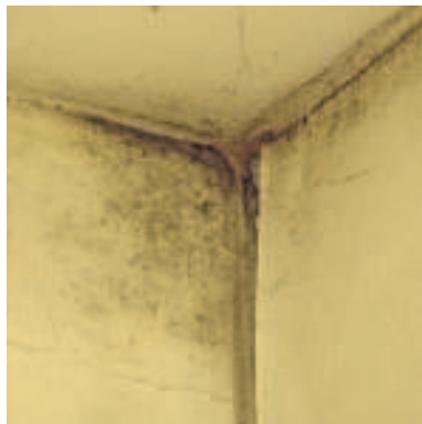
Schimmel in de slaapkamer.